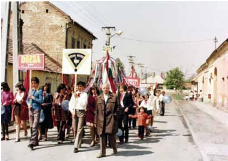
Felvonulási menet a Hunyadi utcán kb. az 1980-as évek második fele

„...énekszó és tánc köszöntse! zeng és dalol az élet...” – való- színű sokan vannak a kedves olvasók között, akik azonnal tudnák folytatni a megkezdett nóta szövegét, hiszen az 1945 utáni évtizedekben ez volt az a dal, amivel már kora reggel éb- resztette a rádió a magyar népet, mintegy bemelegítésként az az- napi, május elsejei nagy felvonulá- sra, demonstrációra, majd a majáliso- zásra, aminek elmaradhatatlan része volt a virsli és a sör. De miért is május első napja lett anno még a 19. század vége felé a munkásság szolidaritásá- nak nemzetközi ünnepe, hiszen e nap gyökerei egészen mások.