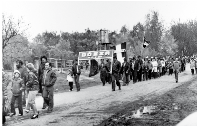
Május elsejei felvonulási menet – kb. 1960/70-es évek - a fürdő mellett