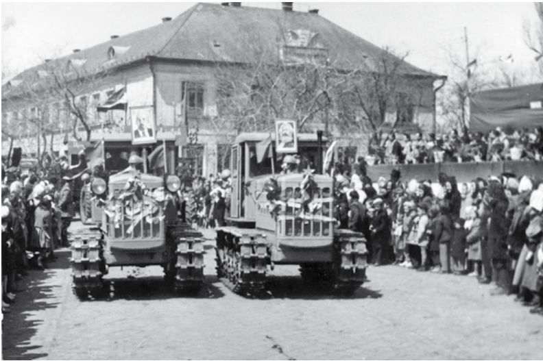
Nánási május 1. kb. 1950-es évek – Lenin és Marx képekkel díszített lánc- talpas traktorok (Sztalinyecek) a kép jobb oldalán látszik a dísztribün