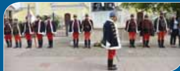
Megjöttek a szép huszárok