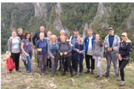
A túraklub tagjai a Szádelői-völgyben

Az EFOP-1.5.3 – 16 – 2017 – 00021 azonosítószámú, „Humán szolgáltatás fejlesztése Hajdúnánáson és vonzáskörzetében” című pályázat keretében Túra Klub működtetésére nyílt lehetőség. A