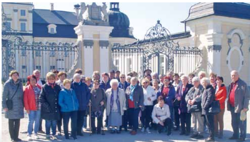
Az első kirándulás az edelényi L'Huillier–Coburg-kastélynél

A közösségekre még egy kirándulás vár: május 26-án a füzerradványi Károlyi-kastélyt, a széphalmi Magyar Nyelv Múzeumát és a sárospataki Rákóczi várat keressük fel.