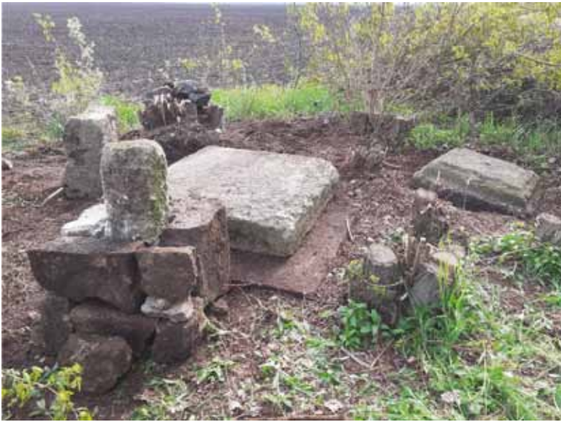
A Réti Jézuska. Az egykori Agócs-kereszt romjai ma

Kévs olyan települése van hazánkban, amely olyan gyönyörűséges határral büszkélkedhet, amilyen a mienk. Különösképpen is fenségtáj a hatalmas kiterjedésű Rét, amely olyan ősi állapotokat idéz, mintha a Tisza hullámai által Isten keze simogatta volna ilyen meséssé. Valahányszor arra járok, mindig megigéz a látványa, miközben lelki szemem előtt tanyákkal telítődik a végtelennek tűnő rónaság. Azokkal a csaknem egymást érő tanyákkal, amelyek a 19. század derekától népesítették be az addig szűzföldnek számító vidéket. Jöttek is a dolgos napszamosok, dohánytermesztők, főként az egri érsekség területéről, leginkább Matyó-földről, hogy ekéikkel feltörjék a háborítatlan földet, s hajlékot teremtsenek családjaik számára. Ők