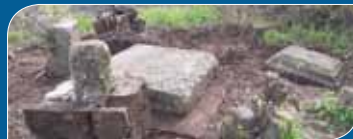
Isten háta mögött