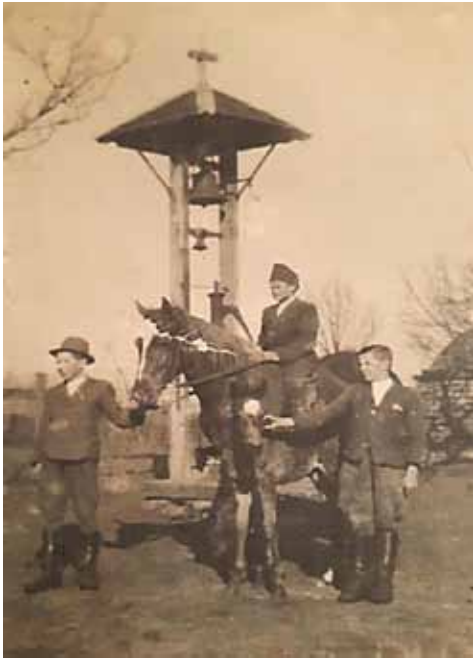
A harangláb az iskola udvarán 1951-ben

Isten tenyerén, a végeláthatatlan síkmezőn, a Réten megtelepedett katolikusság – amint a református tanyabirtokosok is -, a kezdetektől elkövettek mindent azért, hogy hajléka legyen az iskolai oktatásnak, egyben temploma is a hitét mélyen megélt tanyai társadalomnak.