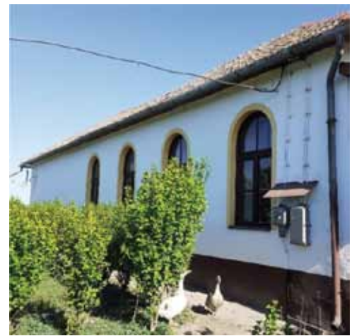
Az iskola déli oldala ma. Ez volt a Rét temploma