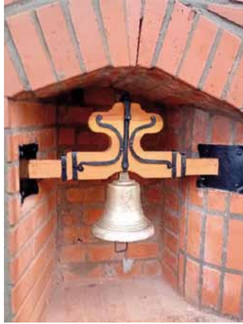
Az 1991-ben készült lélekharang a járommal, és az új alkotás

25 éve annak, hogy 1998 tavaszán barbár kezek ellopták a bástyafal ikonikus tartozékát, a lélekharangot. Minden bizonnyal csak kevesen emlékeznek már rá, milyen volt, és miért készült valójában?