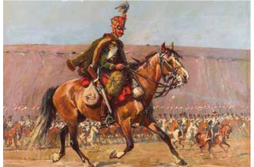
Huszár menetfelszereléssel korabeli ábrázoláson

Úgy tartották, a huszárt és a lovát egyszerre teremtette a Jó Isten. Egy gondolat volt, két testben. Merthogy