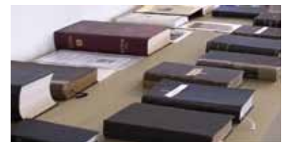
Bibliakiállítás a városi könyvtárban