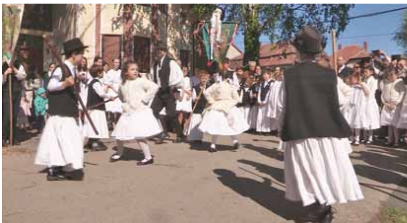
Fehérvasárnapi komatál csere

Úgy vélem, tudomásul kell vennünk, hogy hagyományos ünnepeink megítélése, a hozzájuk fűződő viszony és a belőlük fakadó érzelmek kettéosztják az embereket. Nincsen ez másképp a húsvét tekintetében sem.