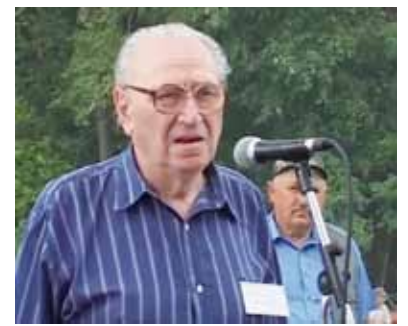
A 2002. évi Aratónapon a Nyakas-farmon

...Munkásságát több kitüntetéssel is elismerték (Nagykunságért díj 1994, Hajdúnánás városért kitüntetés, Kollégiumi Emlékérem 2013, Kunmadaras díszpolgára 2016, a Magyar Érdemrend Tisztikeresztjét kapta 2016-ban), legutóbb 2020-ban