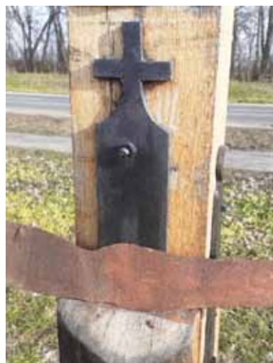
A lemez Krisztuskéz a Határdombi feszület talapzatán