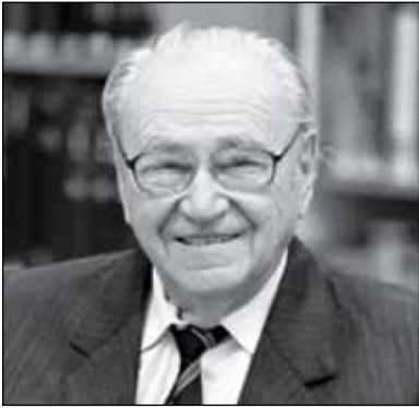
Hajdúnánás, 1930. – Debrecen, 2023.

Egy igen gazdag, tartalmas életút zárult le 2023. március 14-én.