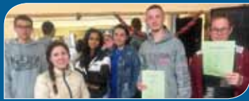
Versenyeredmények a Csihában