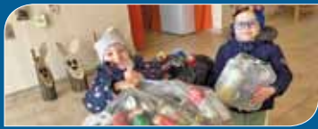
Gyűjtési akció az oviban