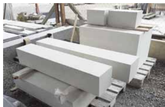
Az új Réti Emlékfeszület kőtömbjei Újfahértón, Török József műhelyének udvarán, 2023. május 15-én

A János-réten álló Agócs-kereszt, vagy Réti Jézuska, amely egyben a Rét temploma is volt, 1965-ben véletlen folytán leborult. Most újjászületik tehát. Köszönetet mondunk azoknak, akik anyagi felajánlásaikkal lehetővé tették, hogy mindez megtörténhessen. Mivel pedig van még lehetőség további felajánlásokra, ezért az itt kö-